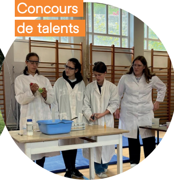
Concours de talents