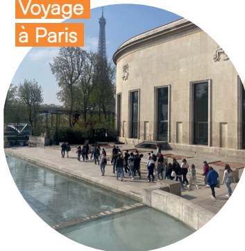
Voyage à Paris