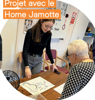
Projet avec le Home Jamotte